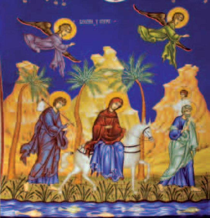
▲ БЈЕКСТВО У ЕГИПАТ ESCAPE TO EGYPT