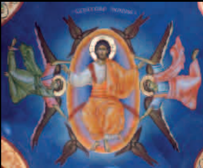
▲ ВАНЕСЕЊЕ ГОСПОДЊЕ / ASCENSION OF CHRIST