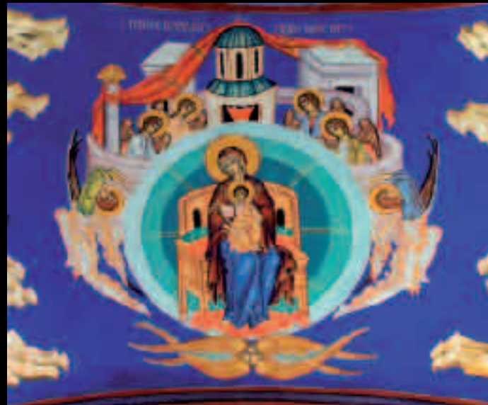
▲ АКАТИСТ ПРЕСВЕТОЈ БОГОРОДИЦИ / AKATHIST TO THE MOST HOLY THEOTOKOS