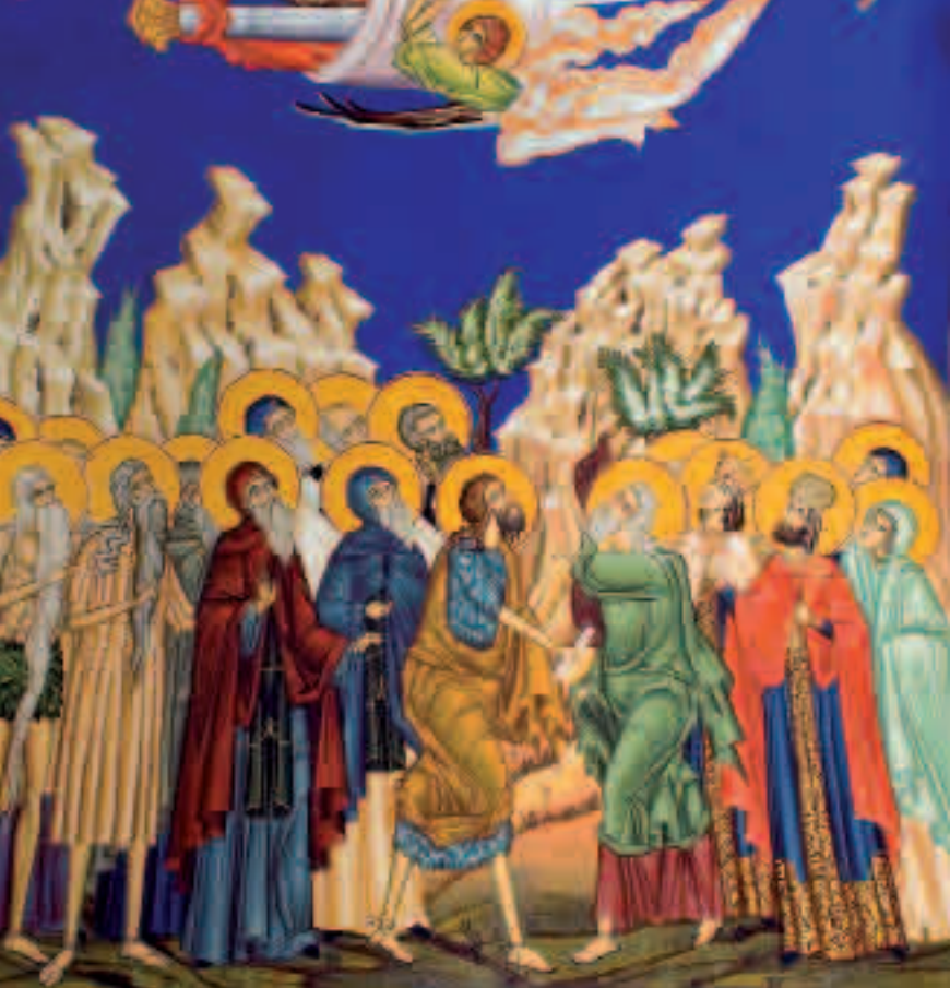
▲ АКАТИСТ ПРЕСВЕТОЈ БОГОРОДИЦИ, ДЕТАЉ AKATHIST TO THE MOST HOLY THEOTOKOS, A DETAIL