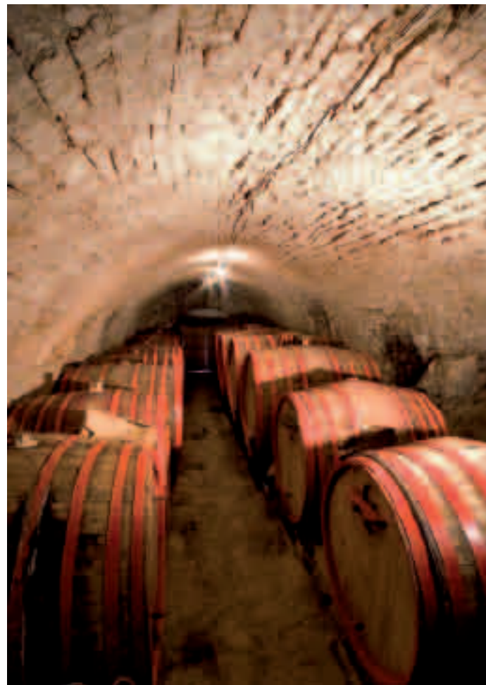
ВИНСКИ ПОДРУМ / WINE CELLAR

The monastic order and hegumen (hieromonk) Savo (Mirić) have taken care of old vineyards and planted new sorts autochthonous to Herzegovina with the help of donations. The red wine from Tvrdoš, also called Vranac, which is kept in oak barrels in the old monastic basement (from the 16 th century) is a first-class red wine, one of the best in the region. Apart from the wine, the monks also make honey. Furthermore, three times a year they issue Vidoslov, the synodicon of the Diocese of Zahum-Herzegovina and the Coastlands), founded by Bishop Atanasije in 1993. Today, Tvrdoš is the ecclesiastical center of the ancient Diocese of Hum founded by Saint Sava, which has existed since 1219.