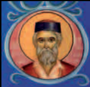
▲ СВЕТИ ВУКАШИН КЛЕПАЧКИ SAINT VUKAŠIN KLEPAČKI